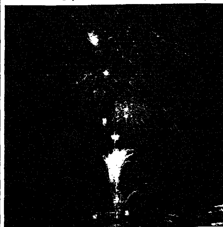
استقبلت هونغ كونغ أمس الأول حلول السنة القمرية الجديدة بالاسم النارية التي اشعلت سماء مرفأ هونغ كونغ والتي بلغت كلفتها حوالي ٢٣٠ الف دولار اميركي - هونغ كونغ - ا ف ب